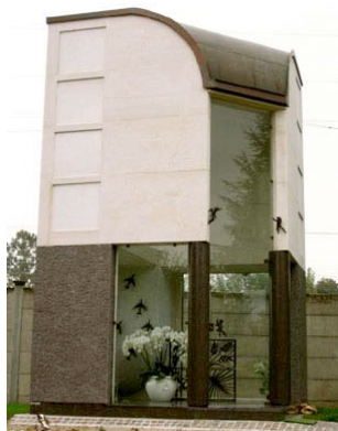
Edicola gentilia di Famiglia anno 2003

Edificata in Botticino e Porfido bocciardato, internamente in marmo di Candoglia con inserti di mosaico.