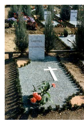
Giardino provvisorio Carlotta con croce o rombo in marmo