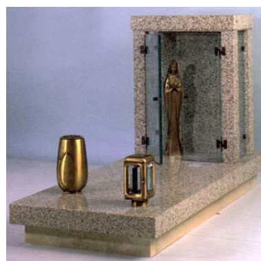
in granito bianco Sardo e tempietto corredato di antine in cristallo Accessori in bronzo Statuetta in similbronzo