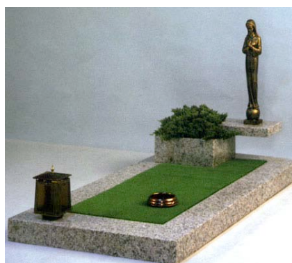
in granito rosa Sardo e p.fiori ad anello e p.luca in bronzo Statuetta in similbronzo Epigrafe in bronzo