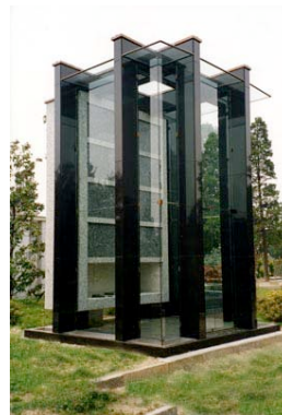
Edicola gentilia di Famiglia costruita nell'anno 1996

Composta con masselli di serizzo antigorio e granito nero di Svezia, completa di cristalli temperati trasparenti, per creare un effetto di grande luminosità