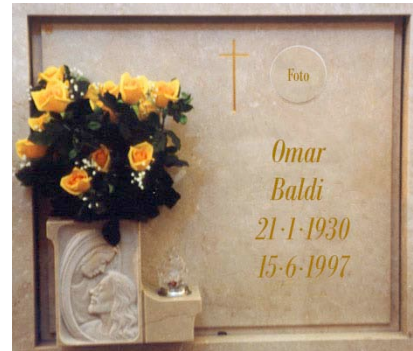
con vaso portafiori scolpito, p.luce, fotoceramica ed epigrafe incise