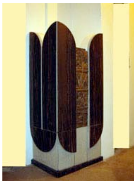
Monumento cenerario in granito Imalaja blu lucido e grezzo. Pannello in bronzo fuso.