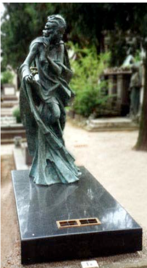
Monumento in verde Serpentino con scultura in bronzo Scultore Ettore Cedraschi