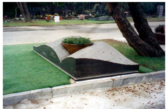
Lavorato a libro aperto, Con fioriera centrale in bronzo