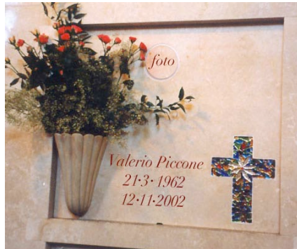
con Croce in cristallo, fotoceramica, portafiori ed epigrafe incisa e colorata