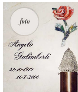
con fotoceramica tonda epigrafe in corsivo incisa e colorata, mosaico eseguito a mano e portalumino in bronzo