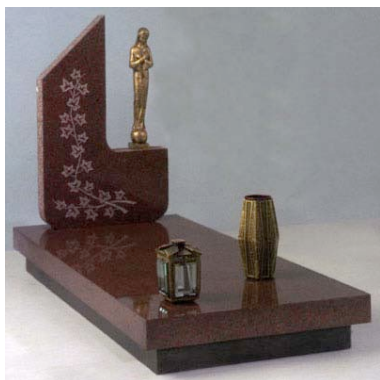
in granito rosso Imperiale completo di cimasa con edera incisa accessori in bronzo statuetta in similbronzo