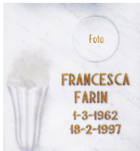
semplice con fotoceramica tonda, epigrafe in stampatello incisa e dorata, portafiori verticale in marmo