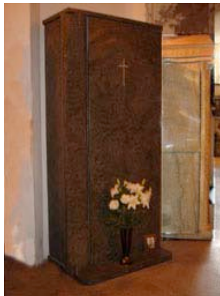
Monumento cenerario in granito verde foresta lucido