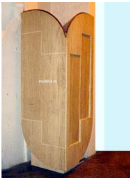
Monumento cenerario in travertino lucido e grezzo