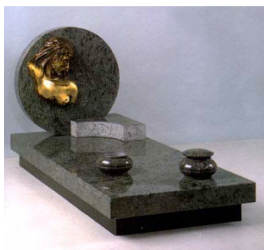
in granito verde Alpi e Volto di Cristo in bronzo Portafori e portalumi in granito torniti Epigrafe incisa e dorata