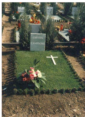
Giardino provvisorio Primavera