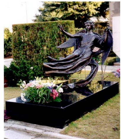
Monumento in granito nero Svezia con statua in bronzo Scultore Pietro Zegna