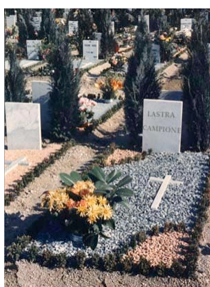
Giardino provvisorio Milano