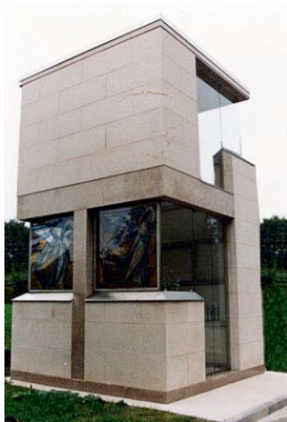
Edicola gentilia di Famiglia anno di costruzione 1985

Interamente costruita in granito rosa di Baveno Bocciardato, completa di vetrate artistiche