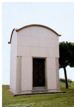
Edicola gentilia di Famiglia costruita nell'anno 2000

Composta con masselli di granito bianco Montorfano con portale in fusione di bronzo e cera persa,