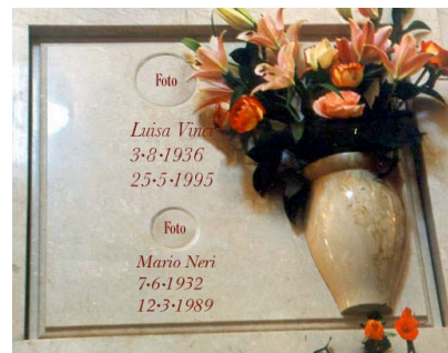
con portafiori tornito, epigrafe e foto per salme e resti