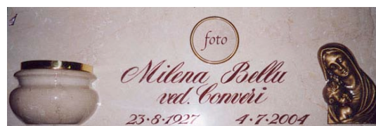
con fotoceramica tonda, epigrafe in corsivo incisa e colorata, madonna con bambino in bronzo e portafiori in marmo