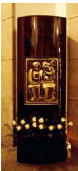
Monumento cenerario in granito nero Africa con pannello in bronzo fuso. Scultore Domenico Colanzi.