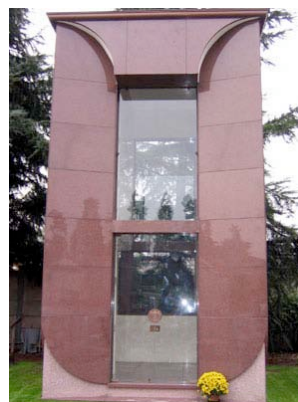
Edicola gentilia di Famiglia anno 2004

Realizzata in masselli di granito Rosso Imperiale e Botticino classico con vetrate trasparenti su tutti e quattro i lati.