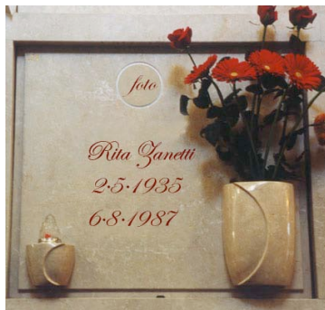
con fotoceramica, portafiori, portalumino ed epigrafe incisa e dorata