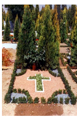
Giardino provvisorio Pallanza 4 angoli e croce floreale