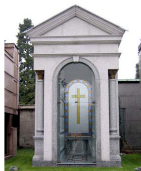
Edicola gentilia di Famiglia edificata nell'anno 2004

Eseguita con masselli monoblocco di granito bianco Montorfano bocciardato e serizzo antigorio, completa di vetrata artistica cattedrale