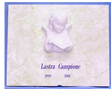
con Angioletto ed epigrafe incisa e colorata